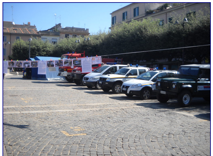
Splendida visuale di Piazza Pia